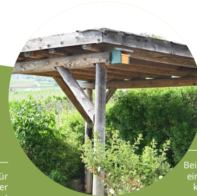
Beispielhafte Anbringung eines Halbhöhlenbrüter- kastens