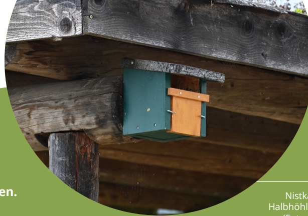
Nistkasten für Halbhöhlenbrüter