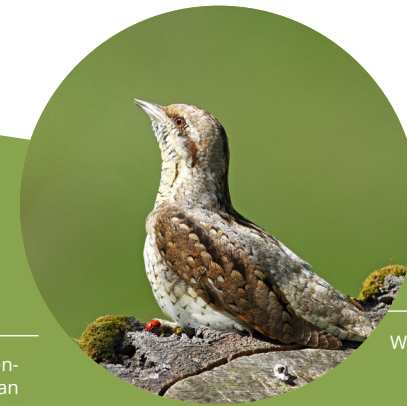
Wendehals auf einem Baumstumpf