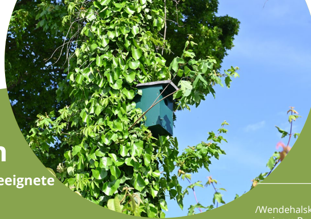
Staren- /Wendehalskasten an einem Baum